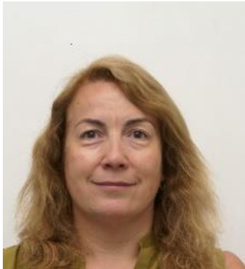
Coordenação: Anabela Cruz-Santos (Instituto de Educação da Universidade do Minho, Portugal)

Dia 2 / 09 / 2021; 14 horas (hora de Portugal); modalidade híbrida